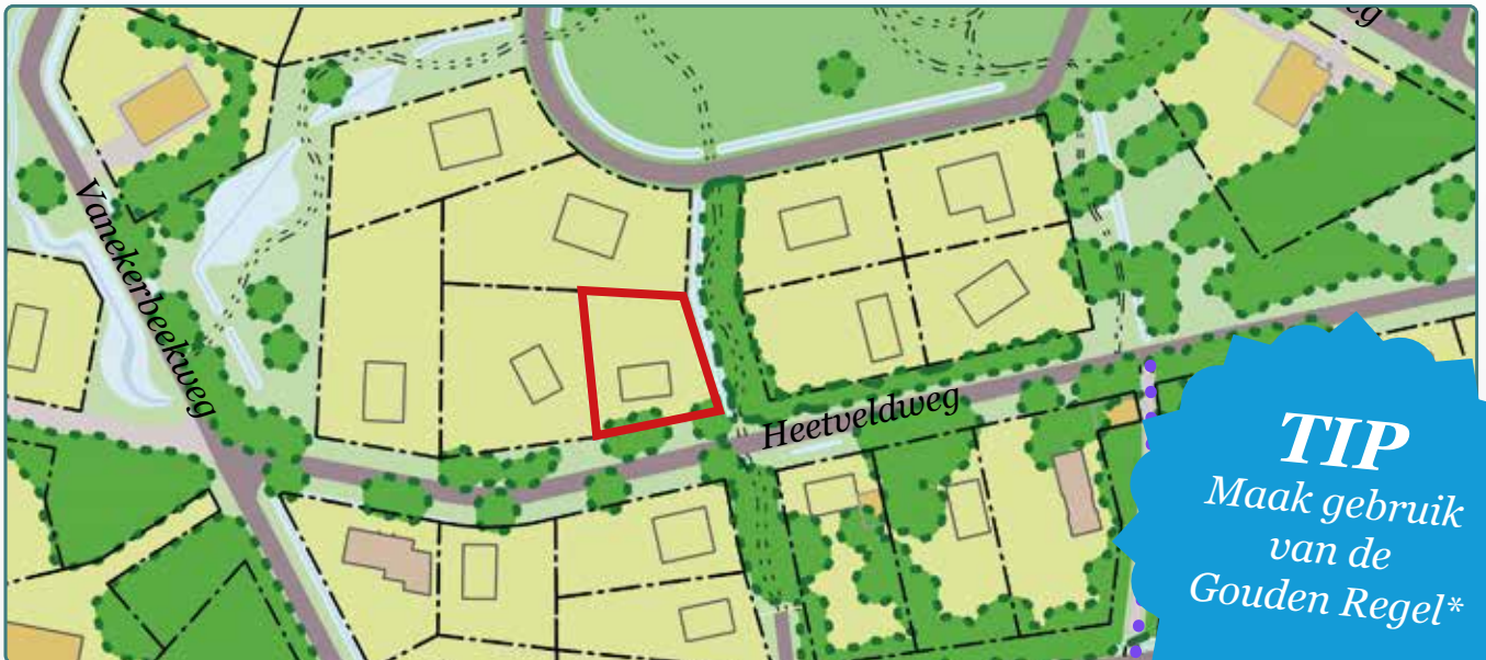
Situatietekening kavel 159