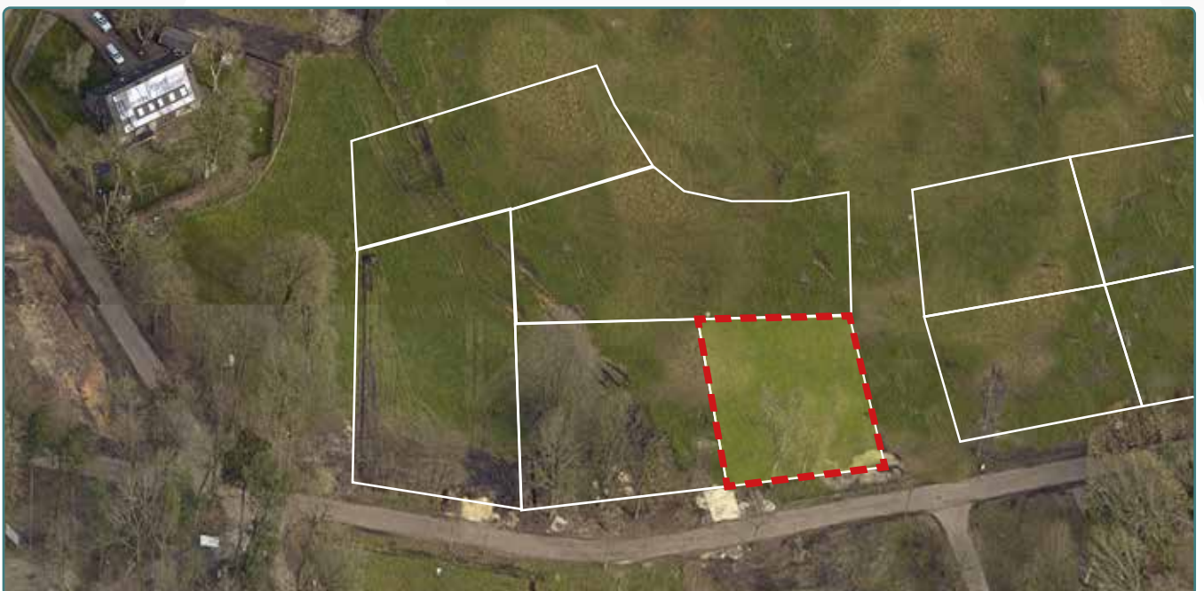
Kavel 159 vanuit de lucht